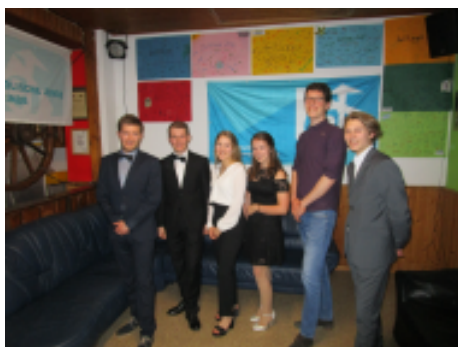
Auch das LT war zahlreich vertreten

Neben einigen Zuschauer*innen verteilten sich 13 Pokervollprofis am 16.02.2019 gegen 19 Uhr an die zwei aufgestellten Tische im KJG-Heim. Nach kurzer Zeit ist das Spiel voll in Fahrt gekommen und die Pokerchips wanderten von Spieler*in zu Spieler*in. Aufgrund eines schlechten Blattes oder fehlender Erfahrung im Pokern schieden nach kurzer Zeit schon die ersten Spieler*innen aus und konnten sich das Geschehen von außen ansehen.