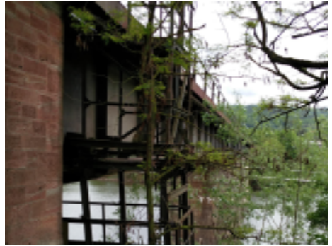
Eins der Bilder von Mister X

dachte nicht mehr gefunden zu werden, konnte ihm die Gruppe doch noch den Weg abschneiden und sich über den Erfolg freuen!