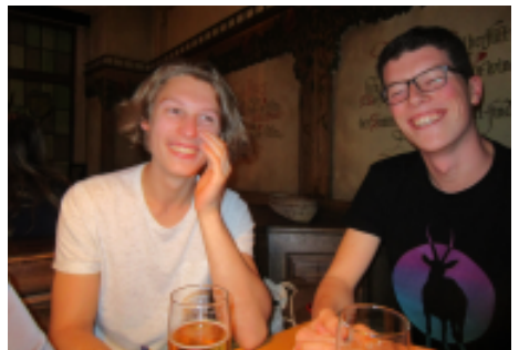
Satt und glücklich

dafür ein, dass es bei Veranstaltungen der KjG Würzburg fleischlose Verpflegungstage gibt. Wir wollten, dass der (jetzt kein Fleisch, sondern der vegetarische) Spieß umgedreht wird. Auf einer mehrtägigen Aktion der Diözese, wie zum Beispiel Gruppenleiter*innenschulungen oder der Herbst DIKO, soll es einen ganzen Tag vegetarische Verpflegung geben. Bei Aktionen, die länger als 3 Tage gehen, wird pro Tag, der dazu kommt, ein zusätzlicher „vegetarischer Tag“ veranstaltet. Auf den Anmeldungen kann jetzt außerdem „Ich möchte fleischhaltige Verpflegung“ angekreuzt werden, sonst gibt es vegetarisches Essen.