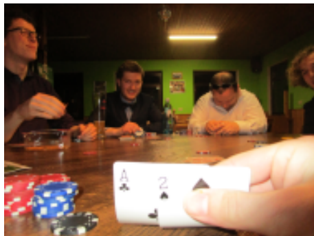
Two pair - noch ahnen sie nicht was ihnen blüht

Nach unzähligen Runden des „bluffen“, „raisen“ oder „callen“ verringerte sich die Anzahl der Spieler*innen immer mehr, so dass wir zum Schluss an einem einzigen Tisch, um den großen Gewinn kämpften. Kurz vor Ende der festgelegten Spielzeit waren nur noch vier Spieler*innen im Rennen und versuchten in den letzten Runden den größten Pott zu gewinnen, um sich abzusetzen.